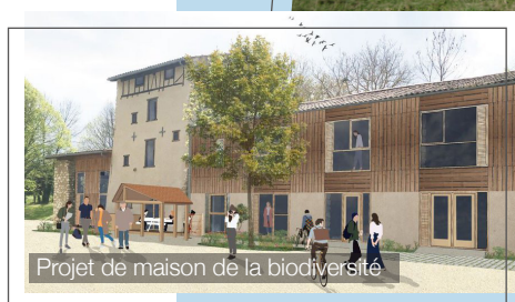
Projet de maison de la biodiversité